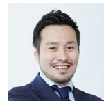
株式会社電通 CXプランニング・センター ECソリューション部 アクティベーションプロデューサー

膨大なECデータと機械学習・AIを組み合わせ、顧客ごとの購買確率を予測し「購入の可能性の高い顧客」まさにいま商品を「欲しいと思う顧客」を特定。郵送DMのリストとして活用することで、従来リストと比較して220%の売上拡大に成功。今回は、生活者とブランドの関係価値の創造・向上を目的に、データ×AI×DMを組み合わせたダイレクトマーケティングのプロセスや事例をご紹介します。