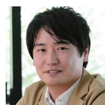
株式会社ヴァリユーズ データマーケティング局 アライアンスG ゼネラルマネジャー

生活者の行動やビジネスのデジタル化、可視化が進み、同時にマーケティングでのデータ活用が進みました。多様で膨大なデータはマーケットを予測する上で貴重な指針ですが、使い方においてはまだまだ研究途上です。2022年のダイレクトマーケティングを予測するためのデータドリブンな手がかりを、セミナー登壇者のお二人と探ります。