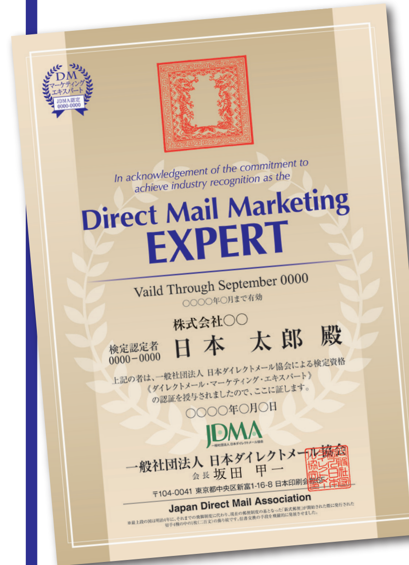
DMマーケティングエキスパート認定証