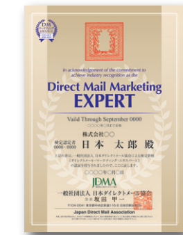
DMマーケティングエキスパート認定証