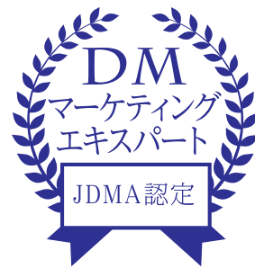
認定資格ロゴマーク