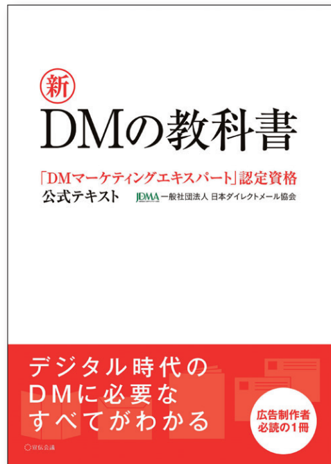
宣伝会議 / 3,300円(税込)

DMマーケティングエキスパート認定資格試験公式テキストです。現代的なDM戦略や戦術が体系的に学べ、理論に加えて実務的なノウハウや事例情報が盛り込まれた販促・マーケティング担当者等にとっての実務教本です。「DMマーケティングエキスパート認定資格試験」の公式テキストとなっており、自己学習し認定試験に合格すれば「DMマーケティングエキスパート」資格取得にもつながる広告業界・印刷業界・制作会社等関係者の必読本です。