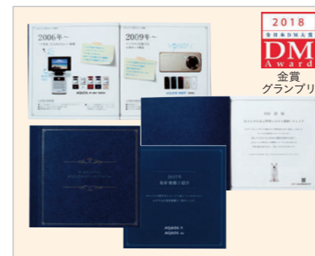
10年間の感謝を込めたあなただけのケータリアルバム 広告主:ソフトバンク 制作者:トッパンフォームズ