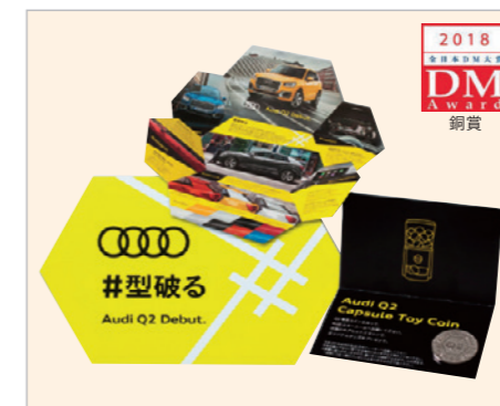
Audi Q2 Debut「#型破る」DM 広告主:アウディジャパン 制作者:電通デジタル