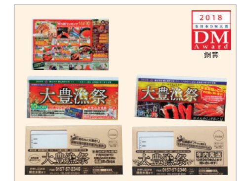
データ分析&改善の継続でROI向上!大豊漁祭DM 広告主:網走水産 制作者:バラシュート