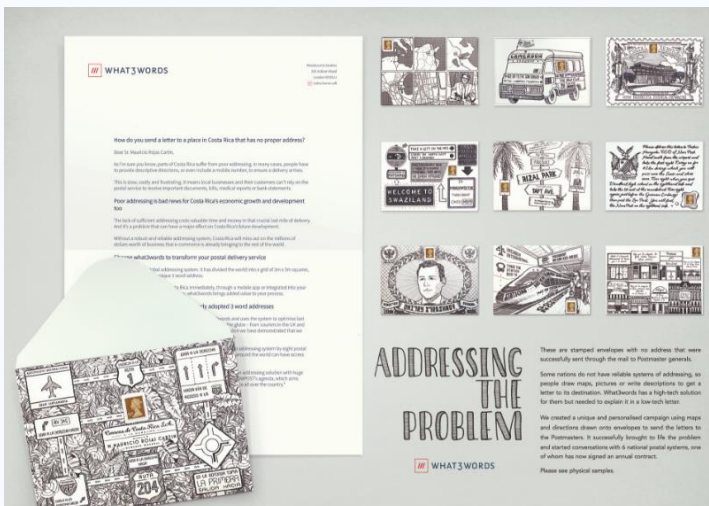
15 かの郵便局長に届けられた DM と外封筒

その国の人たちが郵便を出す時には、手書きの指示、地図、説明など独創的な方法で表現をしている。封筒の表面には、そのように表現された住所をデザインし、絵や文字による住所はそれぞれ独自なもので、現地の郵便配達員が確実に届けてもらうことに託した。このようにデザインされた背後には、受取人である郵便局長に対して、住所制度がないことでどのような問題が生じるか、また、郵便を出そうとしている人にもいかに負担がかかることかをはっきりとわかってもらうことにあった。