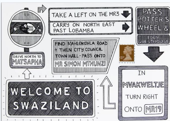
道路標識風の宛名デザインで届け先を示したデザイン