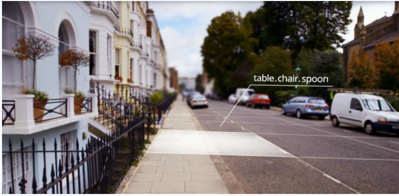
3つの単語の組み合わせで示される住所エリア