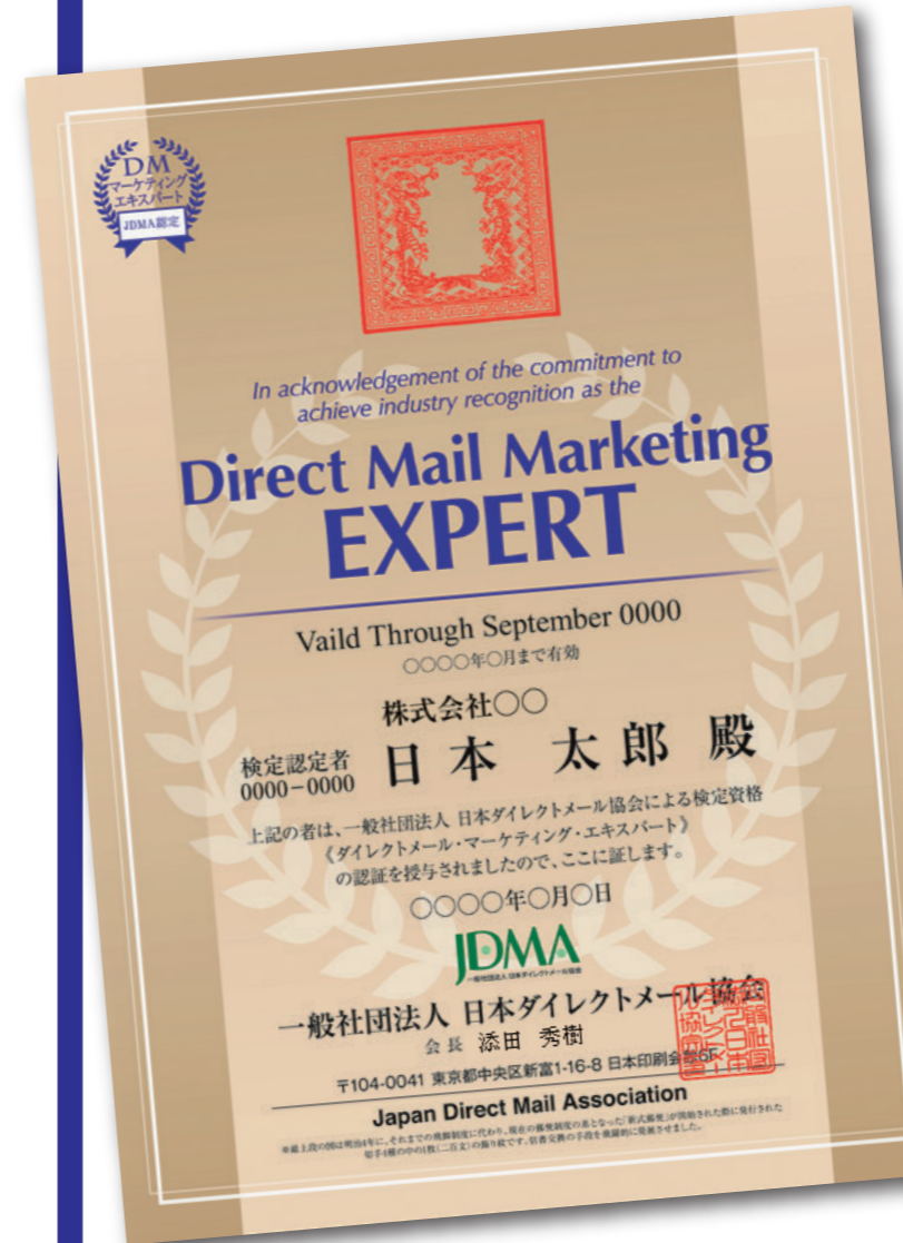
DMマーケティングエキスパート認定証