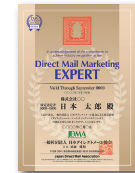
DMマーケティングエキスパート認定証