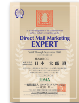
DMマーケティングエキスパート認定証