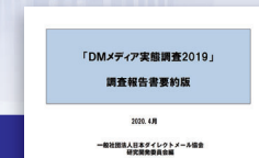
DMメディア実態調査