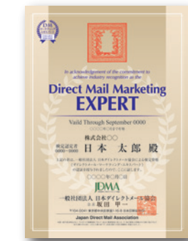
DMマーケティングエキスパート認定証