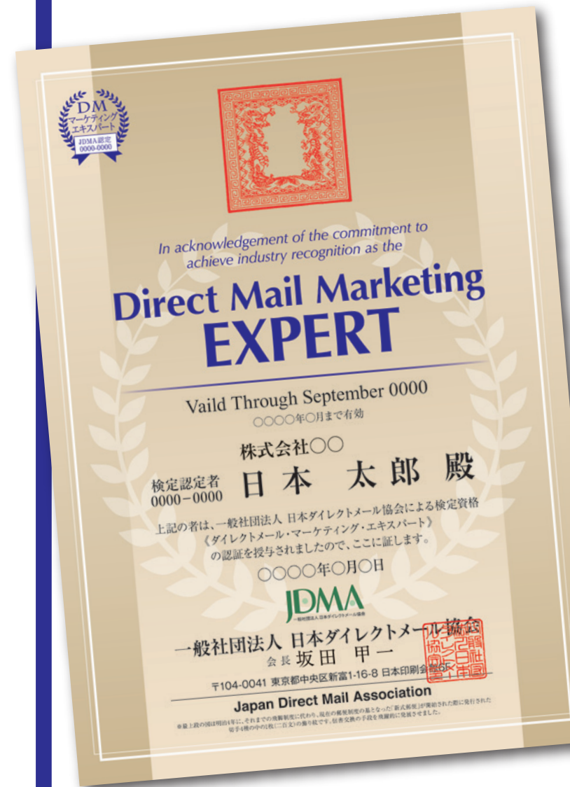
DMマーケティングエキスパート認定証